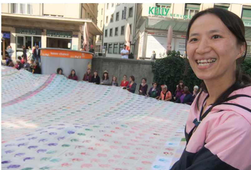
Representantes de trabajadoras del hogar de Asia, CIT 2011.