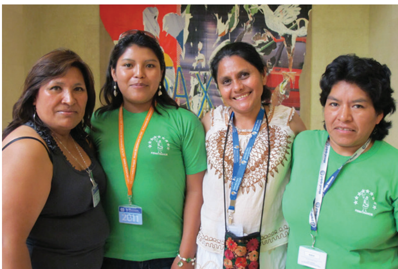
Representantes de trabajadoras del hogar de América Latina, CIT 2011.